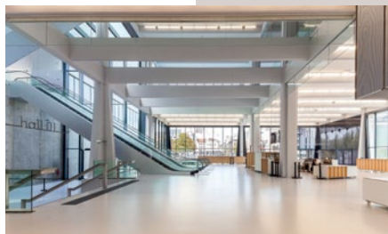
Un hall polyvalent de 600 m 2 .