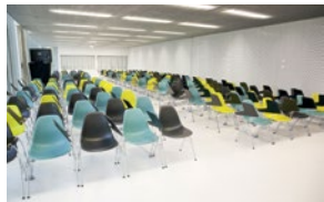
13 salles de commissions.