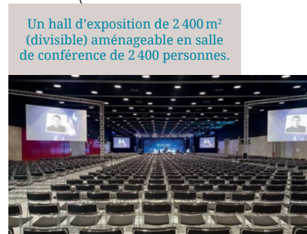
Un hall d'exposition de 2 400 m 2 (divisible) aménageable en salle de conférence de 2 400 personnes.

Situé en cœur de ville, à proximité des grands axes autoroutiers, le Centre de congrès Prouvé permet, grâce à son parking souterrain public intégré de 455 places, un accès et un stationnement facilité pour les automobilistes. Et cela, sans compter les 4 parking supplémentaires du quartier gare !