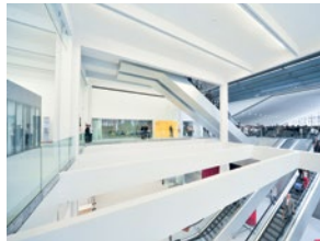
2 espaces Salon de 100 m 2 et 300 m 2 .