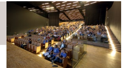
Un auditorium de 850 places disposant d'une scène de 250 m 2 équipée d'un monte charge de grande capacité et modulable à 450 places.